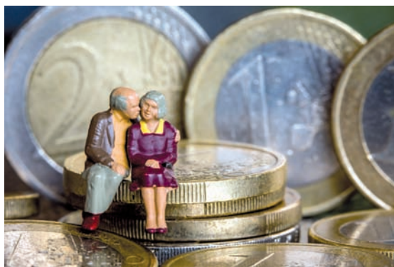
Modellfiguren eines Seniorenpaares sitzen in Schwerin auf Euro-Geldmünzen.

Bei den Zahlen handele es sich lediglich um Schätzungen, sagte