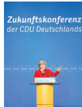
Bundeskanzlerin Angela Merkel spricht in Wuppertal auf der Zukunftskonferenz der CDU.

Und die so Ermutigten nehmen die Chance wahr und lassen ihre Sorgen und Ängste ungefiltert raus. Es gebe bereits „Banden von Asylanten“, die das Asylrecht kriminell missbrauchten, klagt ein CDU-Mitglied. „Das bringt die Bevölkerung auf die Palme. Sowas darf man hier nicht dulden.“ Ein Anderer warnt: „Ich will nicht Schulen erleben, wo Eltern Angst haben müssen, wenn ihre Kinder Schweinefleisch zum Frühstück mitbringen. Wir müssen