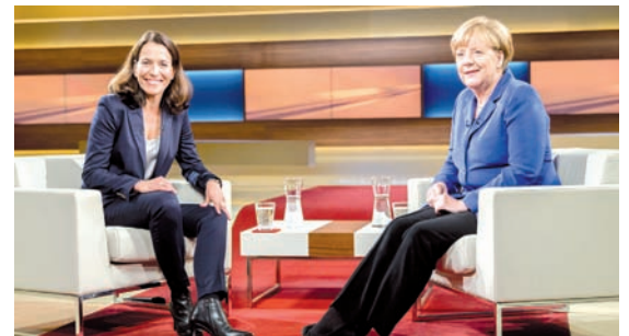
Bundeskanzlerin Angela Merkel (CDU) sitzt TV-Moderatorin Anne Will gegenüber vor Beginn des TV Interviews im Studio in Adlershof in Berlin.

Auf Spekulationen darüber, dass sie am Freitag den Friedensnobelpreis bekommen könnte, reagierte sie eher genervt. „Die Diskussion bedrückt mich fast.“ Sie sei derzeit mit ganz anderen Dingen beschäftigt.