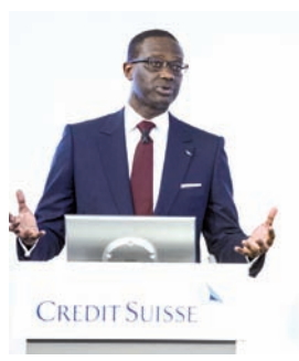
Vorstandschef Tidjane Thiam

Zürich (dpa) – Die schweizerische Großbank Crédit Suisse steht einem Medienbericht zufolge vor einer umfangreichen Kapitalerhöhung. Mit dem frischen Geld wolle der neue Vorstandschef Tidjane Thiam Verluste durch den geplanten Umbau des Konzerns abfedern und das Haus auf eine weitere Verschärfung der Kapitalregeln vorbereiten, berichtete die „Financial Times“ (FT) am Donnerstag auf ihrer Internetseite unter Berufung auf mehrere mit den Plänen vertraute Personen. Die Bank wollte sich zu den Neuigkeiten nicht äußern. Ein genaues Volumen der Kapitalerhöhung wurde in dem Bericht nicht genannt.