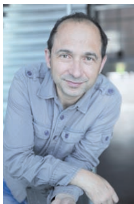
Das undatierte Handout des Hanser Literaturverlages zeigt den Schriftsteller Martin Amanshauser und das Cover des Buches „Der Fisch in der Streichholzschachtel“.

Bis hierher könnte es sich bei „Der Fisch in der Streichholzschachtel“ um