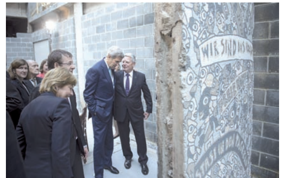
Bundespräsident Joachim Gauck (r) übergibt US-Außenminister John Kerry in Washington ein Stück bemalter Berliner Mauer für den Neubau des Diplomacy Center des Außenministeriums.

Roms umstrittener Bürgermeister Ignazio Marino ist nach einem Skandal um veruntreute Steuergelder zurückgetreten. Er handle im Interesse der Stadt, hieß es in einer Erklärung Marinos, aus der die Nachrichtagentur Ansa am Donnerstagabend zitierte. Ihm bleiben nun 20 Tage Zeit, seine Entscheidung noch einmal zu widerrufen. Auch einige seiner engsten Mitarbeiter waren bereits am Nachmittag zurückgetreten.