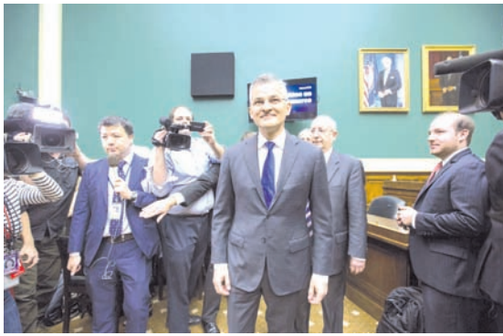
Volkswagens US-Chef Michael Horn kommt zur Anhörung im US-Kongress an.

„Wir werden die Staatsanwaltschaft bei der Ermittlung des Sachverhaltes und der verantwortlichen