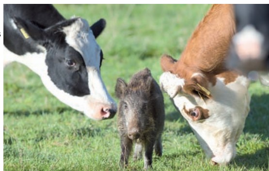
Ein Frischling steht in Meensen im Landkreis Göttingen auf einer Weide zwischen tragenden Rindern.

Vergeben wird der Publikumspreis jeweils am Vorabend der Essener Spielemesse, zu der in diesem Jahr von Donnerstag bis Sonntag (8. bis 11. Oktober) rund 160.000 Besucher erwartet wurden.