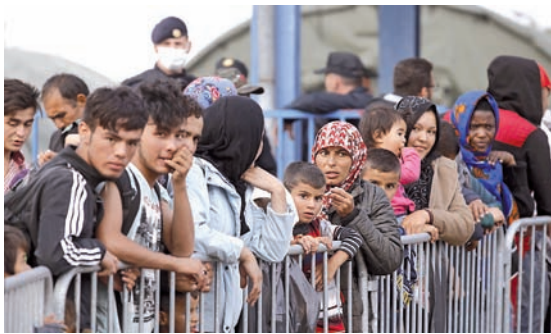
Flüchtlinge warten in einem Flüchtlingslager an der serbisch-kroatischen Grenze nahe Ilok, Kroatien.

Die EU-Außenbeauftragte Federica Mogherini sagte: „Wir stehen vor denselben Herausforderungen rund ums Mittelmeer, wir sitzen im selben Boot.“ Der EU-Kommissar für Nachbarschaftspolitik, Johannes Hahn, sprach von einem globalen Flüchtlingsproblem: „Es geht nicht darum, heiße Kartoffeln hin