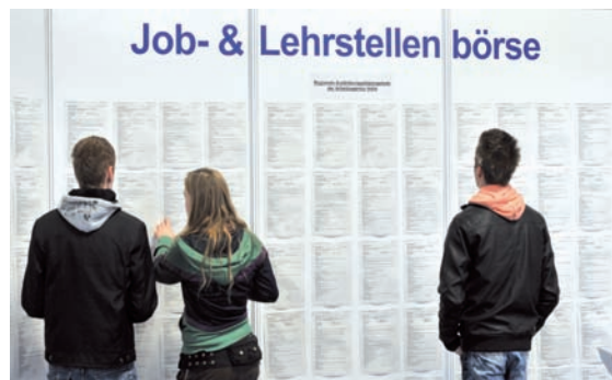
Berufseinsteiger informieren sich auf einer Aus- und Weiterbildungs-messe an einer Job- und Lehrstellenbörse (Archivbild).

Die absolute Zahl der arbeitslosen Jugendlichen ging – gemessen am Krisenhöchststand 2009 – bis 2014 um 3,3 Millionen auf 73,3 Millionen zurück.