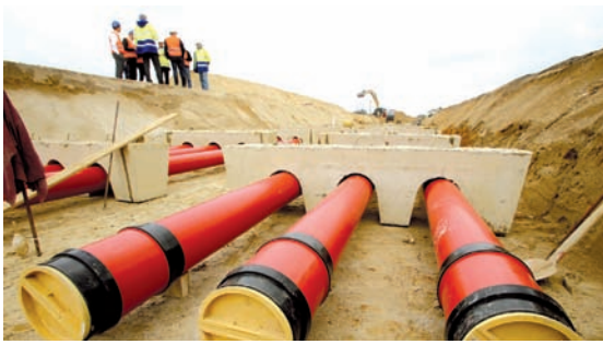
Kunststoffrohre, durch die Strom-Erdkabel gezogen werden, sind auf der Amprion Baustelle in Raesfeld Nordrhein-Westfalen verlegt worden (Archivbild).