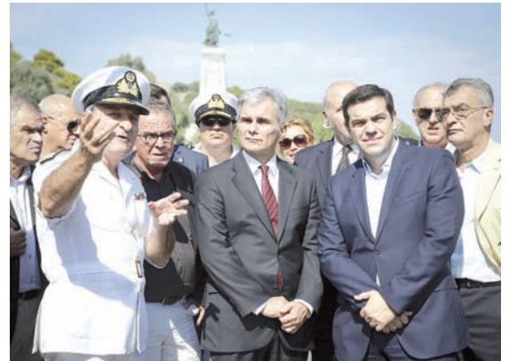
Der griechische Regierungschef Tsipras (2.v.l.) und sein österreichischer Kollege Faymann (M) machen sich ein Bild von der Lage der Flüchtlinge auf der Ostägäisinsel Lesbos.