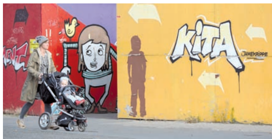
Eine Mutter geht mit ihrem Kind in einem Kinderwagen vorbei an einem Graffiti „KITA“ in Hannover.