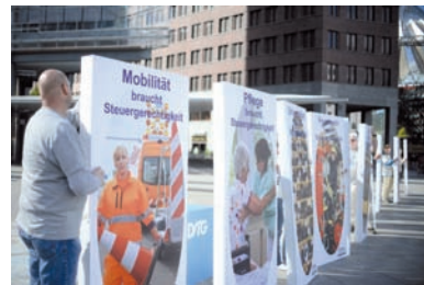
Demonstranten halten in Berlin selbstgebaute Domino-Steine unter anderem mit dem Aufdruck „Mobilität braucht Steuergerechtigkeit“ und „Pfleger braucht Steuergerechtigkeit“.

Die Organisation für wirtschaftliche Zusammenarbeit und Entwicklung (OECD) legte gestern in Paris das Maßnahmenpaket vor. Die ersten sieben Schritte waren bereits 2014 präsentiert worden, die restlichen folgen nun. Die Finanzminister der G20 wollen das Paket