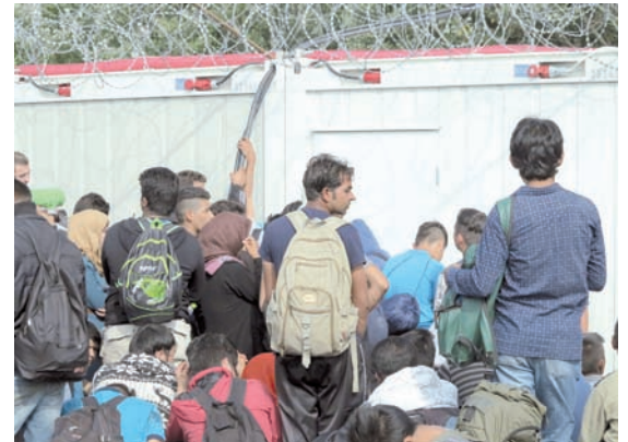
Am Grenzübergang Röske 1 nach Ungarn, der geschlossen ist, warten Flüchtlinge vor dem Registrierungscontainer. Ungarn hat seine Grenze zu Serbien für Flüchtlinge geschlossen. Lediglich an zwei Stellen entlang des 175 Kilometer langen Grenzraums richteten die Behörden sogenannte „Durchlasspunkte“ oder „Transitzonen“ ein, in denen eine begrenzte Zahl an extrem verkürzten Asylverfahren durchgeführt werden kann.

Aus Regierungskreisen hieß es, ein solches Gesetz bedeute keineswegs, dass in kürzester Zeit flächendeckend Transitzonen an der bayerisch-österreichischen Grenze entstünden. Es gehe nur darum, die rechtliche Möglichkeit für ein solches Verfahren zu schaffen, um bei Bedarf darauf zurückgreifen zu können. Daher gebe es auch noch kei-