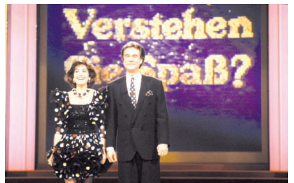
Paola und Kurt Felix moderieren eine Ausgabe ihrer Unterhaltungssendung „Verstehen Sie Spaß?“.

Die Fernsehshow mit Filmen der versteckten Kamera läuft bis heute, moderiert wird sie von Guido Cantz. „Mich hat sehr beeindruckt, wie liebevoll Kurt und Paola Felix miteinander umgegangen sind“, sagt der