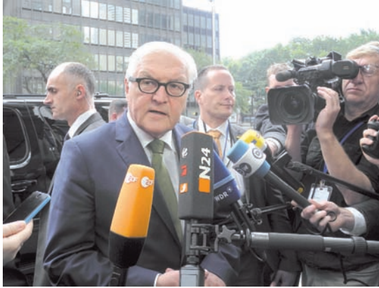
Außenminister Frank-Walter Steinmeier (SPD, vorne) spricht in New York, USA, mit Journalisten.

Die brutale Diktatur von Machthaber Baschar al-Assad müsse aber beendet werden. Zugleich gelte es, die Herrschaft der Terrormiliz Islamischer Staat (IS) zu brechen. Um die Zukunft Assads hatten vor allem die USA und Russland heftig gestritten: Washington und viele andere Länder wollen einen Neuanfang, Russland sieht Assad trotz