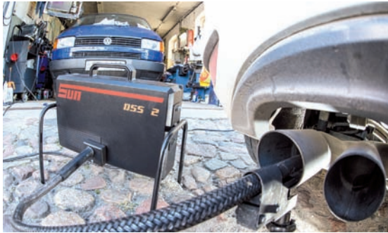
Ein Messschlauch eines Gerätes zur Abgasuntersuchung für Dieselmotoren steckt im Auspuffrohr eines VW Golf 2.0 TDI, fotografiert in einer Werkstatt in Frankfurt (Oder) (Brandenburg).

Auch die kommende Woche verspricht nicht ruhiger zu werden. Am Dienstag spricht der neue VW-Chef Matthias Müller in Wolfsburg