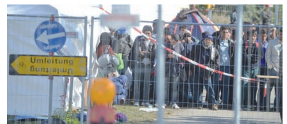
Flüchtlinge warten an der österreichisch-deutschen Grenze bei Freilassing.

La Paz (dpa) – Boliviens Staatschef Evo Morales hat dem österreichischen Bundespräsidenten Heinz Fischer seine Anerkennung für die Landeurlaubnis seines Flugzeugs 2013 in Wien ausgesprochen. Morales hat Fischer in La Paz mit einem Orden ausgezeichnet. Mehrere europäische Staaten hatten Anfang Juli 2013 der bolivianischen Präsidentenmaschine auf der Rückreise von einem Besuch in Moskau den Flugraum gesperrt, weil das Gerücht lief, der ehemalige US-Geheimdienstler Edward Snowden befinde sich an Bord. Morales musste eine Nacht im Wiener Flughafen verweilen, bis sich erwies, dass Snowden Russland nicht verlassen hatte. Beide Staatschefs unterzeichneten ein Abkommen zur Erweiterung der Zusammenarbeit in Infrastrukturprojekten.