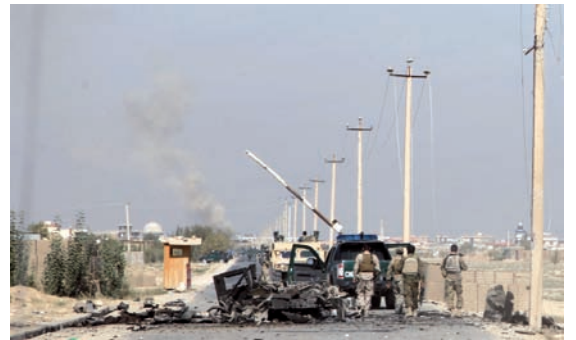
Afghanische Sicherheitsbeamte gehen an einem verbrannten Autowrack vorbei.

Die Aufständischen hatten Kundus Anfang der Woche erobert, wurden am Donnerstag aber wieder von Regierungstruppen vertrieben. Die Bundeswehr war vor zwei Jahren aus der Provinz abgezogen. Rund 700 deutschen Soldaten sind 150 Kilometer entfernt in Masar-i-Scharif stationiert. „Wir haben den Deutschen mehrfach gesagt, dass wir sehr besorgt über ihren Abzug sind“, sagte Daneschi. „Wir wussten, dass wir die Lage nicht alleine würden kontrollieren können. Aber sie haben uns alleine gelassen. Die Entscheidung, aus Kundus abzuziehen, war verfrüht.“