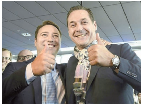
Manfred Haimbuchner (l) und Heinz-Christian Strache feiern den Sieg der FPÖ in Oberösterreich.

Die SPÖ rutschte in Oberösterreich gegenüber der Wahl 2009 um 6,6 Prozentpunkte auf 18,4 Prozent ab, erkannte aber an, dass das Thema Asyl und die vielen Tausende Neuankommlinge entschei-