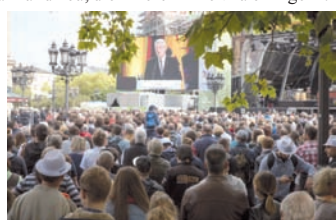
Hunderte Menschen verfolgen in Frankfurt am Main vor der Alten Oper die Übertragung der Ansprache von Bundespräsident Joachim Gauck beim Festakt zur Feier von 25 Jahren deutscher Einheit.

Es wäre schön, wenn der Bundespräsident Recht behält, und den Neuankömmlingen – wie er zum Abschluss seiner Ansprache sagt – „Ein Leben – wie es unsere Nationalhymne beschreibt – in Einigkeit und Recht und Freiheit“ geboten werden kann. Doch, ob dies wirklich realisiert werden mag, scheint von Tag zu Tag mal mehr, mal weniger vorstellbar. Diese Hoffnung wird getrübt durch „Uneinigkeit“ zwischen einigen Bundesländern! Wenn es schon innerhalb der Bundesrepublik zu Streitigkeiten in einigen Fragen der Asylpolitik und Verteilung der Neuankömmlinge kommt, wie kann es dann erst auf europäischer Basis zu Solidarität und Übereinstimmung kommen? Und vor allem letzteres ist schließlich – wie auch Gauck betonte („Es kann keine Lösung in der Flüchtlingsfrage geben – es sei denn, sie ist europäisch.“) – Voraussetzung, um die Herausforderungen der Migrationswelle bewältigen zu können. Sogar am Tag der Einheit kam es innerhalb der Bundesländern zu gegenseitiger Kritik, Beschuldigungen und scharfen Debatten. So kritisierte Bayerns Innenminister Joachim Herrmann die niedersächsische Regierung, weil das Land weniger Flüchtlinge aufnehme als es müsste, wohingegen Bayern im September über 16.000 mehr Asylbewerber aufgenommen habe, als es nach Verteilung der Länder vorgesehen sei. Anstatt gemeinsam an einer gerechten Asylpolitik zu arbeiten, schieben sich die Länder untereinander Schuld und Verantwortung zu. Könnte die Zerbrechlichkeit einer „Einheit“ deutlicher werden?