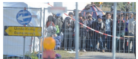
Flüchtlinge warten an der österreichisch-deutschen Grenze bei Freilassing.

La Paz (dpa) – Boliviens Staatschef Evo Morales hat dem österreichischen Bundespräsidenten Heinz Fischer seine Anerkennung für die Landeurlaubnis seines Flugzeugs 2013 in Wien ausgesprochen. Morales hat Fischer in La Paz mit einem Orden ausgezeichnet. Mehrere europäische Staaten hatten Anfang Juli 2013 der bolivianischen Präsidentenmaschine auf der Rückreise von einem Besuch in Moskau den Flugraum gesperrt, weil das Gerücht lief, der ehemalige US-Geheimdienstler Edward Snowden befinde sich an Bord. Morales musste eine Nacht im Wiener Flughafen verweilen, bis sich erwies, dass Snowden Russland nicht verlassen hatte. Beide Staatschefs unterzeichneten ein Abkommen zur Erweiterung der Zusammenarbeit in Infrastrukturprojekten.