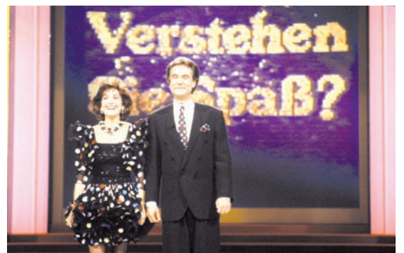
Paola und Kurt Felix moderieren eine Ausgabe ihrer Unterhaltungssendung „Verstehen Sie Spaß?“.

Die Fernsehshow mit Filmen der versteckten Kamera läuft bis heute, moderiert wird sie von Guido Cantz. „Mich hat sehr beeindruckt, wie liebevoll Kurt und Paola Felix miteinander umgegangen sind“, sagt der