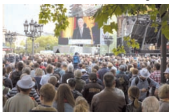
Hunderte Menschen verfolgen in Frankfurt am Main vor der Alten Oper die Übertragung der Ansprache von Bundespräsident Joachim Gauck beim Festakt zur Feier von 25 Jahren deutscher Einheit.

Es wäre schön, wenn der Bundespräsident Recht behält, und den Neuankömmlingen – wie er zum Abschluss seiner Ansprache sagt – „Ein Leben – wie es unsere Nationalhymne beschreibt – in Einigkeit und Recht und Freiheit“ geboten werden kann. Doch, ob dies wirklich realisiert werden mag, scheint von Tag zu Tag mal mehr, mal weniger vorstellbar. Diese Hoffnung wird getrübt durch „Uneinigkeit“ zwischen einigen Bundesländern! Wenn es schon innerhalb der Bundesrepublik zu Streitigkeiten in einigen Fragen der Asylpolitik und Verteilung der Neuankömmlinge kommt, wie kann es dann erst auf europäischer Basis zu Solidarität und Übereinstimmung kommen? Und vor allem letzteres ist schließlich – wie auch Gauck betonte („Es kann keine Lösung in der Flüchtlingsfrage geben – es sei denn, sie ist europäisch.“) – Voraussetzung, um die Herausforderungen der Migrationswelle bewältigen zu können. Sogar am Tag der Einheit kam es innerhalb der Bundesländern zu gegenseitiger Kritik, Beschuldigungen und scharfen Debatten. So kritisierte Bayerns Innenminister Joachim Herrmann die niedersächsische Regierung, weil das Land weniger Flüchtlinge aufnehme als es müsste, wohingegen Bayern im September über 16.000 mehr Asylbewerber aufgenommen habe, als es nach Verteilung der Länder vorgesehen sei. Anstatt gemeinsam an einer gerechten Asylpolitik zu arbeiten, schieben sich die Länder untereinander Schuld und Verantwortung zu. Könnte die Zerbrechlichkeit einer „Einheit“ deutlicher werden?