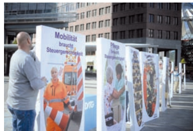
Demonstranten halten in Berlin selbstgebaute Domino-Steine unter anderem mit dem Aufdruck „Mobilität braucht Steuergerechtigkeit“ und „Pfleger braucht Steuergerechtigkeit“.

Die Organisation für wirtschaftliche Zusammenarbeit und Entwicklung (OECD) legte gestern in Paris das Maßnahmenpaket vor. Die ersten sieben Schritte waren bereits 2014 präsentiert worden, die restlichen folgen nun. Die Finanzminister der G20 wollen das Paket